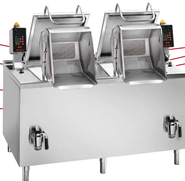
CMPDG2-12 VERSIONE GAS GAS HEATED