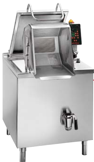
CPMIV1-12 VERSIONE VAPORE STEAM HEATED