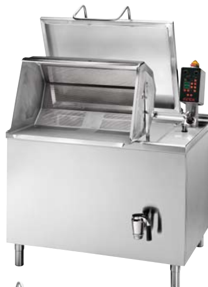
CPMDE1-24 VERSIONE ELETTRICA ELECTRIC HEATED